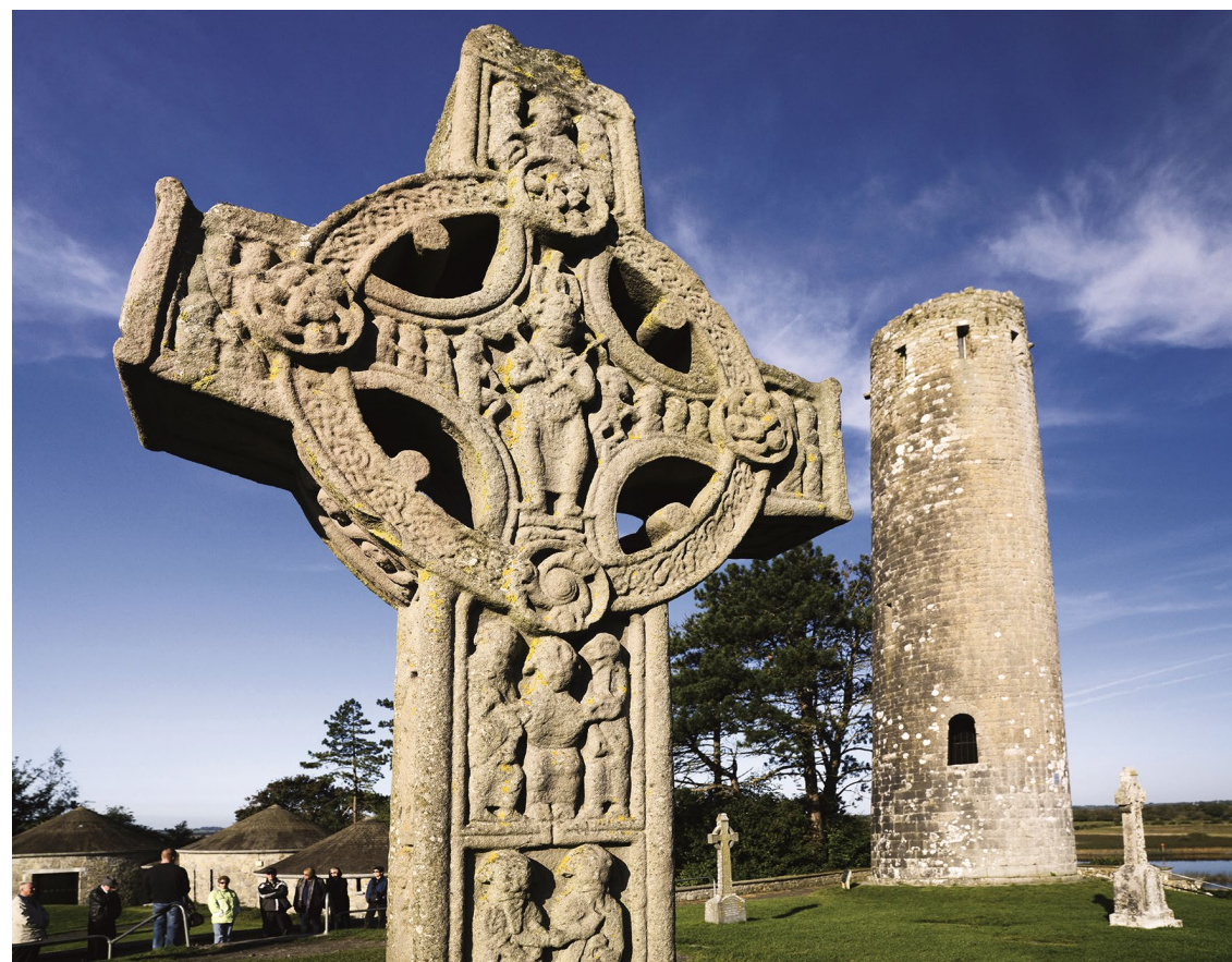
Irishes Hochkreuz